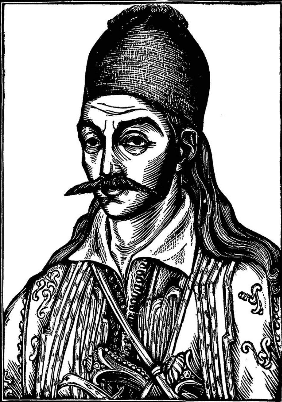
ΠΡΟΤΟΜΗ ΤΟΥ ΓΕΩΡΓΙΟΥ ΚΑΡΑΪΣΚΑΚΗ (Χαρακτικό ΒΑΣΟΣ ΚΑΤΡΑΚΗ)